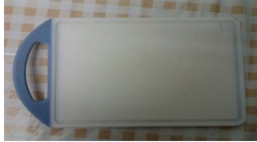
TABLA DE CORTAR