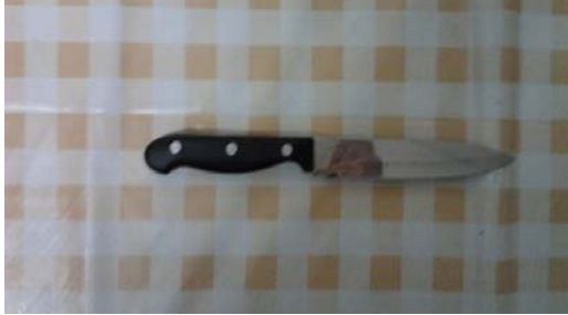
CUCHILLO PARA CORTAR